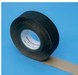
JUTADACH SP 38

šířka 50 mm, návin 25 m, tloušťka 0,62 mm