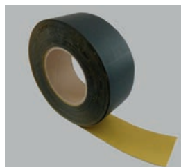
JUTADACH MASTIC SUPER

šířka 60 mm, návin 25 m, tloušťka 0,62 mm